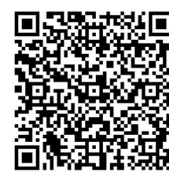
申込用紙による入会