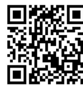
インターネット入会

電話：090-8378-9588 メール：info@musashino-bunren.com